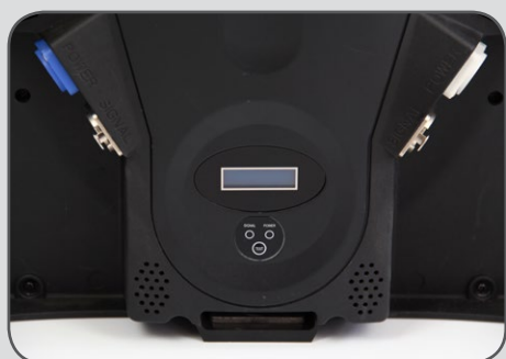
Display di controllo