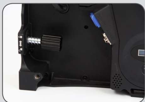
Sistema di chiusura "Easy Locking"