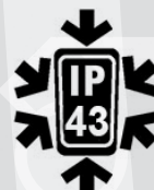
Grado di protezione IP43